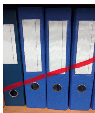
Линия из цветного скотча задает интуитивно понятную хронологию среди папок с документами.

Да, она показывает хорошие результаты. Когда к нам приходят аудиторы или контролеры, порядок и чистота на рабочих местах сразу формируют позитивный имидж подразделения. Мы много работаем с бумажными документами, и система 5С помогает организовать интуитивно понятный порядок среди большого количества разных папок. Так, мы рассортировали их по датам и пометили цветным скотчем по диагонали в одну линию. Если одну папку убрать или переставить, линия исчезнет. С такой системой порядка не страшно, если бухгалтер уйдет в отпуск, и поиск нужной информации не вызывает проблем ●