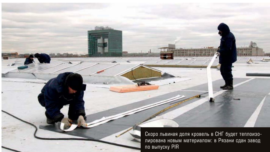
Скоро львиная доля кровель в СНГ будет теплоизолирована новым материалом: в Рязани сдан завод по выпуску PIR